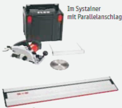
Im Systainer mit Parallelanschlag